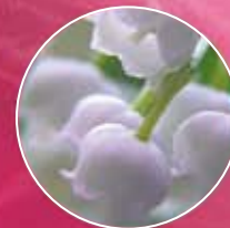
FM213 | КОНВАЛІЯ