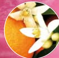
FM218 | ЦВІТ АПЕЛЬСИНУ