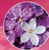
FM211 | БУЗОК