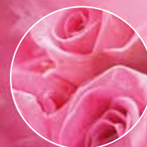
FM217 | ТРОЯНДА