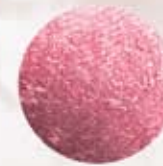
ЦВЕТУЩАЯ РОЗА FM | r004