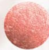
ВКУСНАЯ ПАПАЙЯ FM | r003